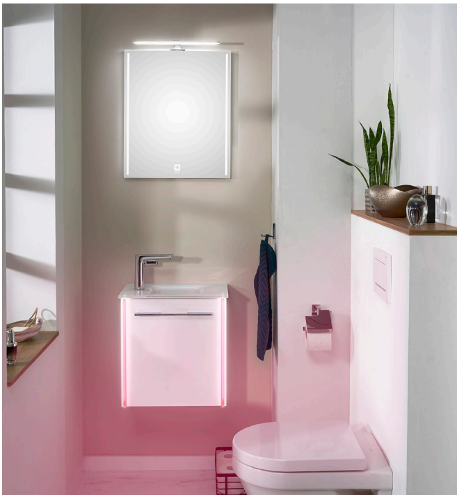
LEO 116 im Optiwhite-Dekor und LEDrelax-Beleuchtung in Rot von LEONARDO living