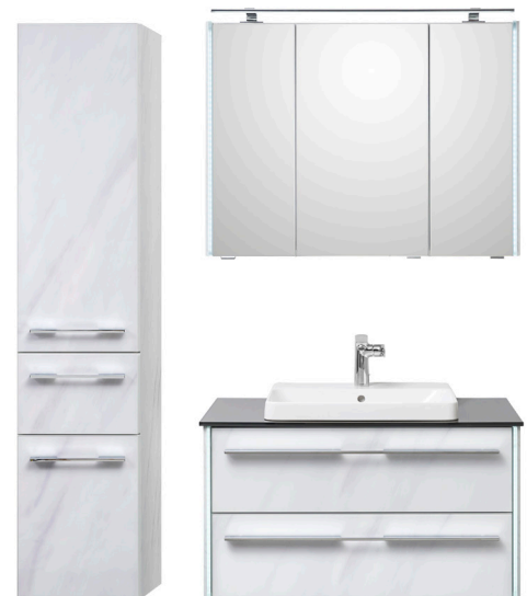
LEO 116 in weißem Marmor-Dekor von LEONARDO living