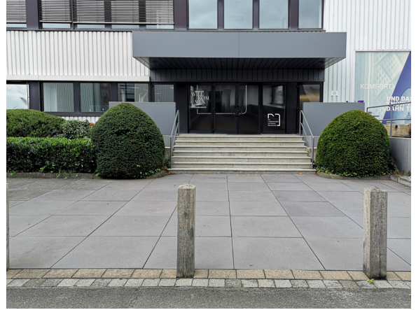
Bilder: Loddenkemper Unternehmensstandort

Vom 10. bis 12. April 2024 stellt Leonardo LIVING zahlreiche aktuelle Kollektionen im Loddenkemper-Showroom in Oelde vor.